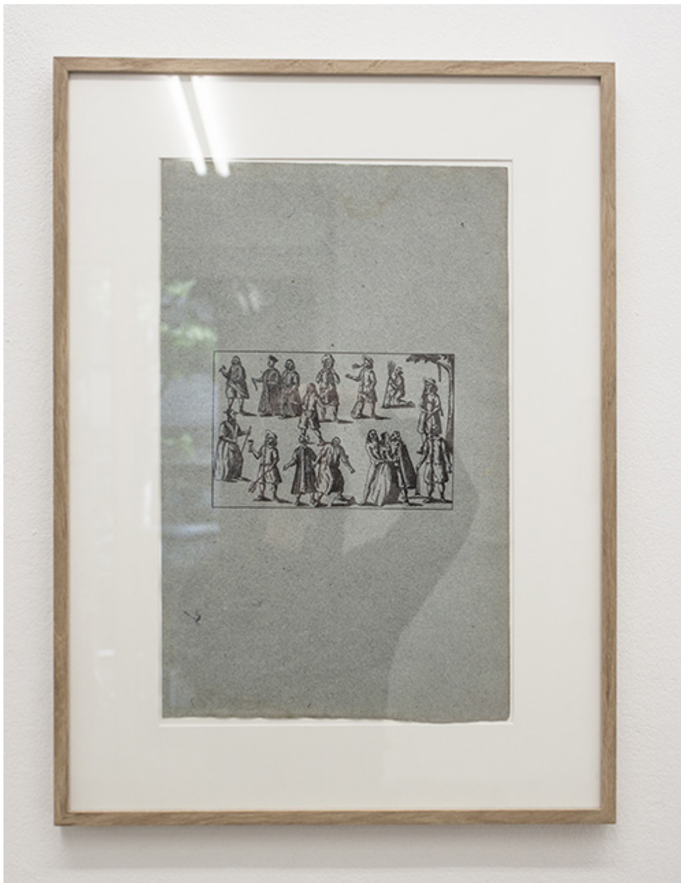
Ben Kinmont Antinomians, 1659, 2019 Encore noire sur papier de couleur bleue hollandais ou français du 18e siècle 38,4 x 24 cm / 52,8 x 38,8 x 2,5 cm Unique

Les personnages présents dans « Antinomians » sont les personnifications des différents groupes politiques et religieux du milieu du 17e siècle (entre 1640-1650). Parmi ces groupes sont représentés les Quakers, Les Niveleurs, Les Familistes, les Seekers et les Adamites (qui pratiquent le nudisme à l'image d'Adam dans le Jardin d'Eden). La représentation d'une femme dans la littérature populaire en tant que membre radical est inhabituelle. Généralement les femmes étaient dépeintes comme des sorcières ou dans des scènes domestiques. Elle est ici représentée avec un Adamite et un Familiste. John Everard, qui était un proche de Mary Everard, était un familiste reconnu. Cette gravure est un détail de Chrysomeon, a golden meane (Londres: 1659) de Spencer Benjamin.