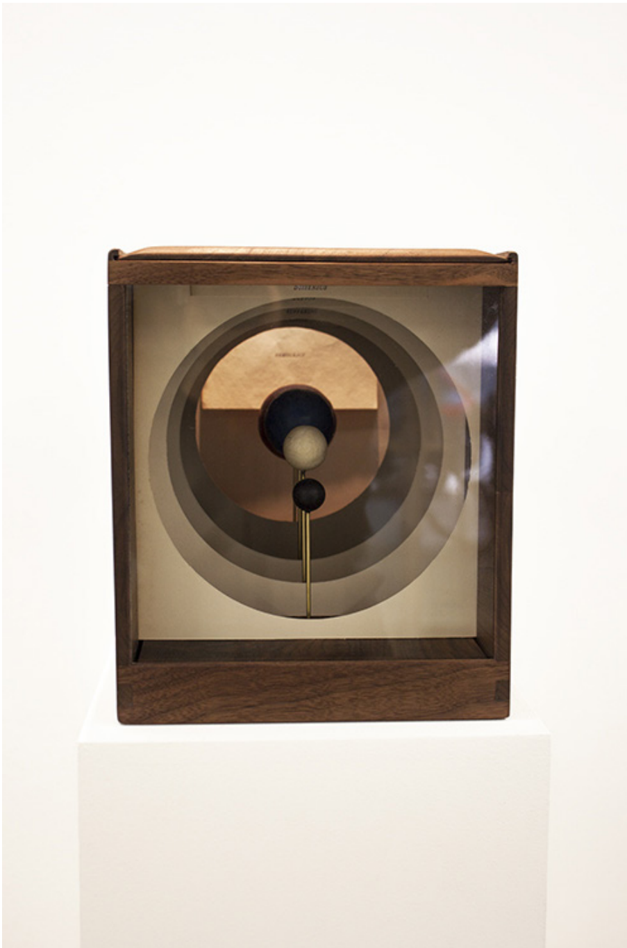
Ben Kinmont Democracy peepshow, 2018-19 Noyer, 4 sphères en cire d'abeille teintée, 5 éléments en papier Vergé, verre ancien. 25,5 x 21,7 x 35 cm Unique

Les premiers Peepshows - ancêtres des salles de divertissement et du théâtre de rue - sont apparus au milieu du XVe siècle. Ils sont généralement composés d'une série de cartes insérées dans une boîte en bois, le spectateur pouvait y voir des lieux exotiques, des scènes historiques ou des intrigues dont l'histoire se déroule d'une carte à l'autre. Ils sont également considérés comme l'ancêtre de la photographie et du cinéma. Le Democracy peepshow illustre les sphères de Mary Evrard et les différentes étapes du consensus, de la souffrance, de l'action et du dissensus, et de leur rassemblement en démocratie.