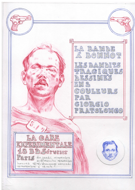
Giorgio Pratolongo Bande à Bonnot , 2021 encre et crayon sur papier histoire 14 feuillets ; 16 portraits

https://www.instagram.com/gpratolongodrawings/?hl=fr