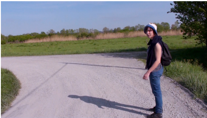
Mathieu Kiefer Le Grand Ordinaire , 2020 film, 81 min

The film will be on view until February 19.