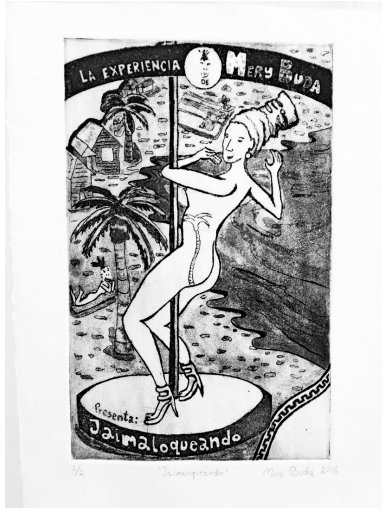
Mery Buda Jaimaloqueando , 2018 copperplate engraving, etching and aquatint, paper