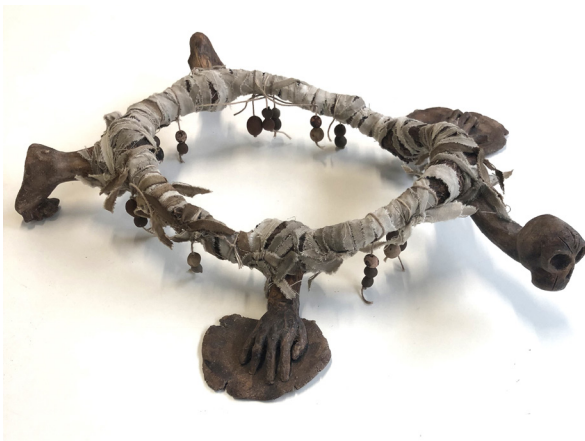
Daisy Bruley Tortue , 2018 terracotta, plaster, fabric and string

https://daisy-bruley.fr/ https://garexp.org/