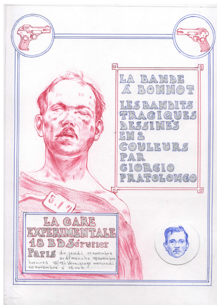
Giorgio Pratolongo Bande à Bonnot , 2021 ink and pencil on paper history 14 sheets; 16 portraits

https://www.instagram.com/gpratolongodrawings/?hl=fr